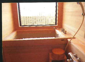
MIZUHO 客房内浴池“白木浴池”