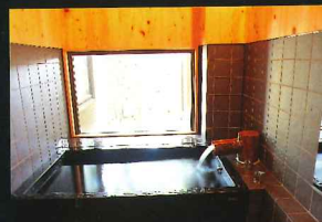
MIZUHO 客房内浴池“漆木浴池”