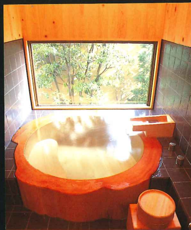
MIZUHO 客房内浴池“圆木浴池”