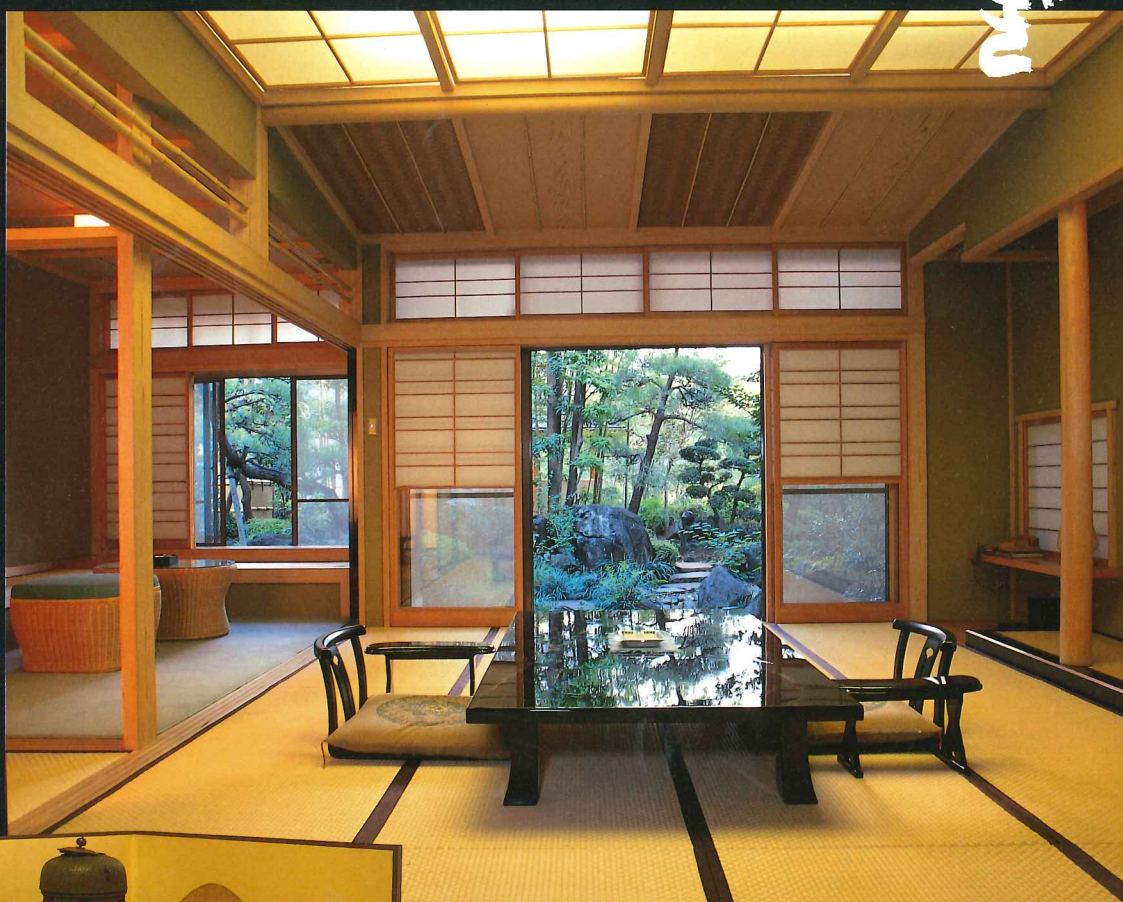
MIZUHO “秀麗廳” 養浩 Mizuho Guest Room YOUKOU