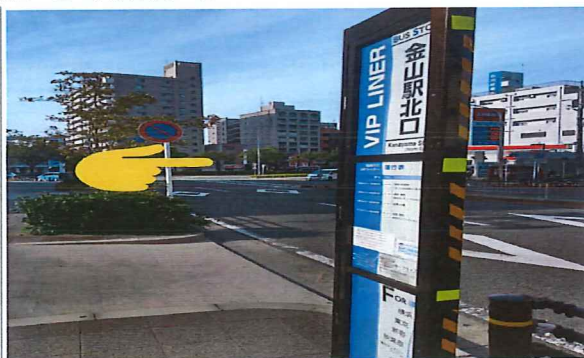
從金山車站北口徒步4分鐘， 本社專用站點