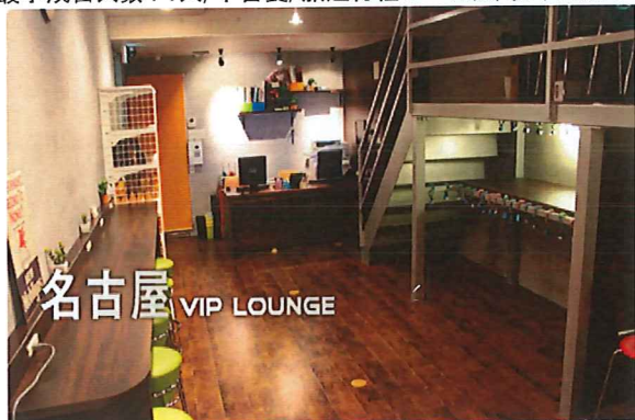
集合 名古屋 VIP 候車 室

最小成團人數：1人/不含餐/旅遊行程：一日遊/發車地點：名古屋/乘坐交通：巴士/添乘員：有