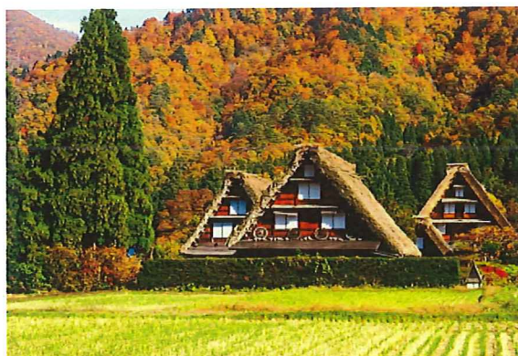
110多棟合掌造 連成一片，美輪美奐