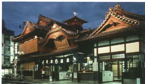
由香川縣高松站乘JR到愛媛縣的道後溫泉約需3小時，單程車費就要¥4,050，利用JR Pass就非常划算。

遊客利用此Pass可自由乘搭四國地區內所有電車，可自選2至5天有效期Pass，在行程安排上更富彈性。建議大家於香川縣周遊吃名物讚岐烏冬後，再坐車到愛媛縣的道後溫泉泡名湯，盡情擁抱四國的自然美景和鄉土風情。