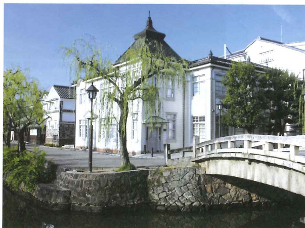
倉敷市集歷史與文化於一身，持有「Kansai WIDE Area Pass」便可穿梭關西與這個岡山著名的城市。