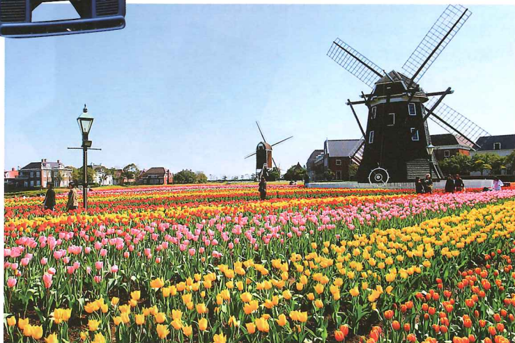
豪斯登堡仿照17世紀的荷蘭古堡而建，是長崎縣必遊的景點。