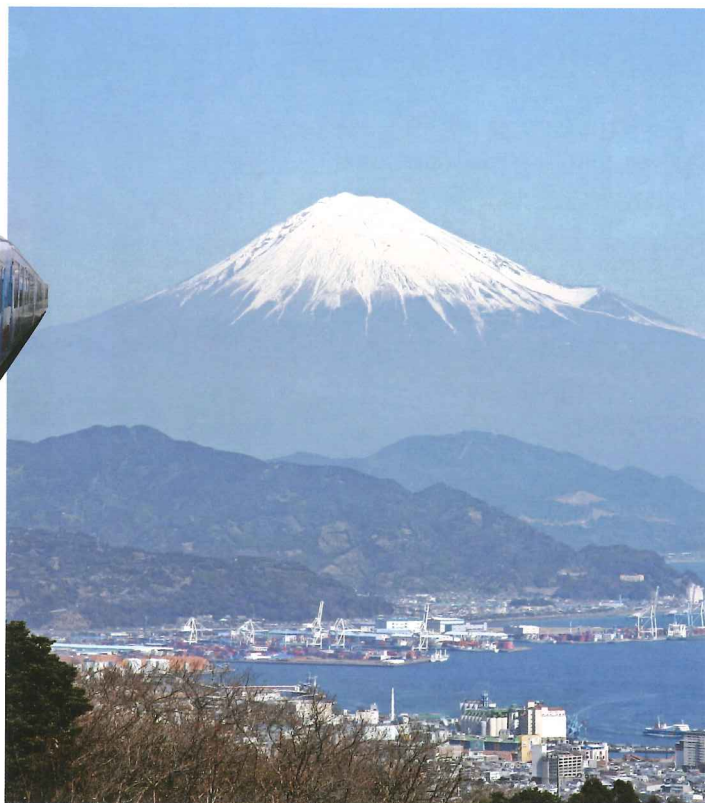
暢遊富士山之餘，使用這款周遊券還可到白糸の滝、十國峠、伊豆三津海洋樂園、東海大學海洋科學博物館等景點遊覽，無論到富士山一帶賞景或親子遊都很划算。