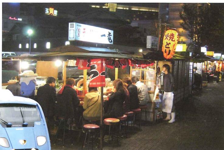
福岡的屋台主要集中在天神渡邊通、昭和通、中洲區域的那珂川沿岸、櫛田神社旁的冷泉公園及長濱區域等地，每天傍晚都紛紛開檔，十分熱鬧。