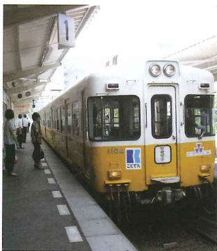
位於香川縣的琴平車站洋溢著鄉村風味，村上春樹最愛的鳥冬店「小縣家」就在附近。

栗林公園、鳴門漩渦、祖谷溪、四萬十川、道後溫泉全是日本引以為傲的自然景觀及建築。今年4月四國推出首張適用於香川、德島、高知、愛媛4縣各主要鐵道的「All Shikoku Rail Pass」，遊客可在指定限期內任搭總長度達1,100公里的鐵道，輕而易舉就可感受到日本最純樸自然的一面！