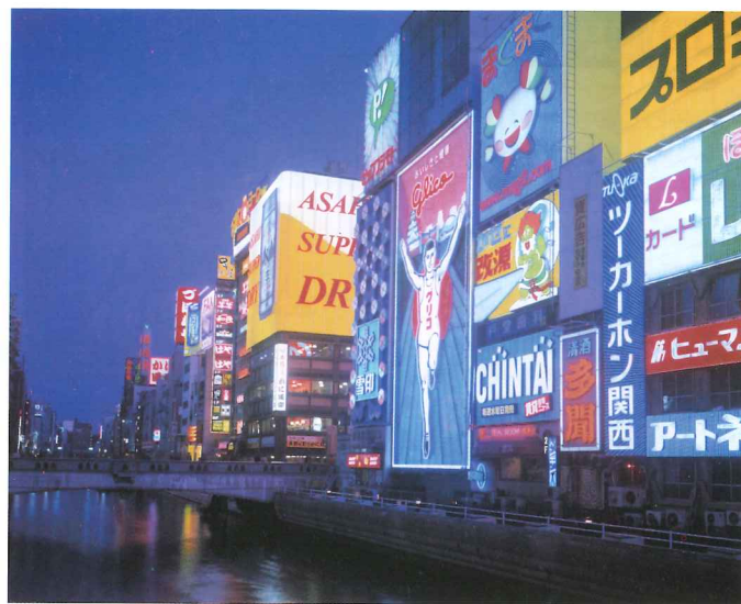
由大阪乘JR到神戶、京都或奈良只是幾百円，持「Kansai WIDE Area Pass」前往岡山、城崎溫泉等地區則划算得多。