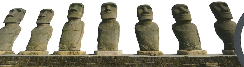
想以特惠交通費去宮崎縣日南海岸觀光，出發前就要買張「全九州地區周遊券」。