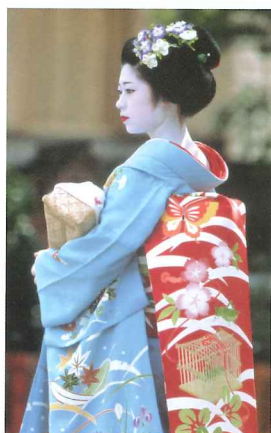
1張車票就可任意到京、阪、神各地觀光，感受截然不同的文化色彩。

想一次過體驗多姿多彩的旅遊樂趣，推介你來關西玩番轉！Shopping精可到大阪盡情掃貨；對歷史文化有興趣當然要去京都、奈良、姬路展開懷古之旅；而神戶新舊交融的景色與美食同樣引人入勝。遊客只需乘搭JR西日本鐵路，更可輕鬆往返關西和九州。